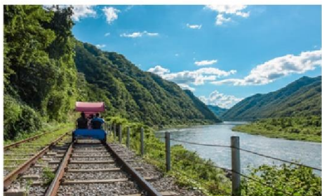
( Rail Bike )