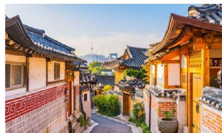
หมู่บ้านโบราณฮุกซอน