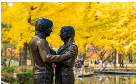
เกาะนามิ