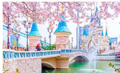
สวนสนุกล็อตเต้เวิลด์