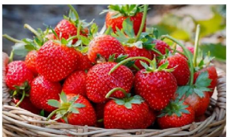
ฟาร์มสตรอเบอร์รี่