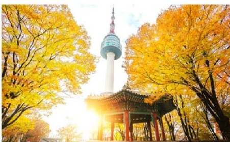
โซลทาวเวอร์