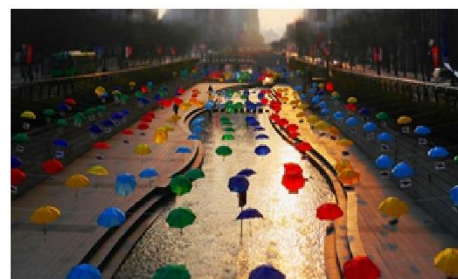
คลองชองเกซอน