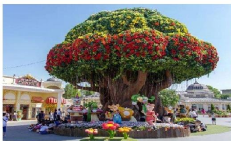
สวนสนุกเอเวอร์แลนด์