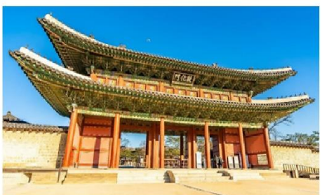
พระราชวังชางด็อกกุง